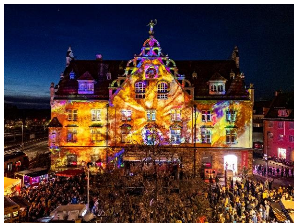
„Vernissage für alle“ vor dem Kunstmuseum Lindau.

Sollte es am Freitag zu wetterbedingten Programm-Änderungen kommen, wird dies in den Medien bekannt gegeben